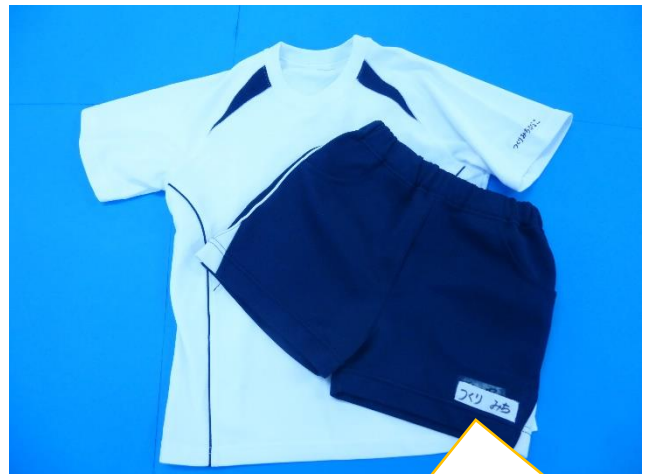
【3. 4. 5歳児 体操服】

名前のタグを上着、ズボンそれぞれに、縫い目にそってつけてください。体操服の内側のタグにも記名をお願いします。