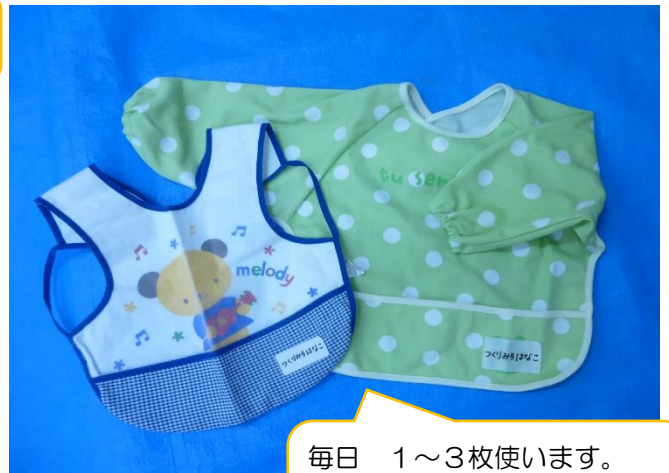
【0. 1. 2歳児 食事用エプロン】