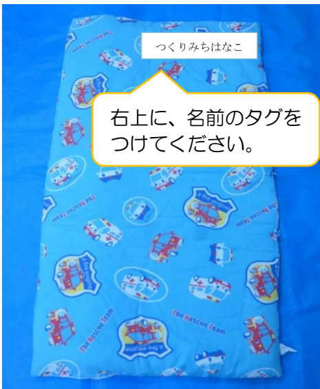
【午睡用具 敷布団・表】