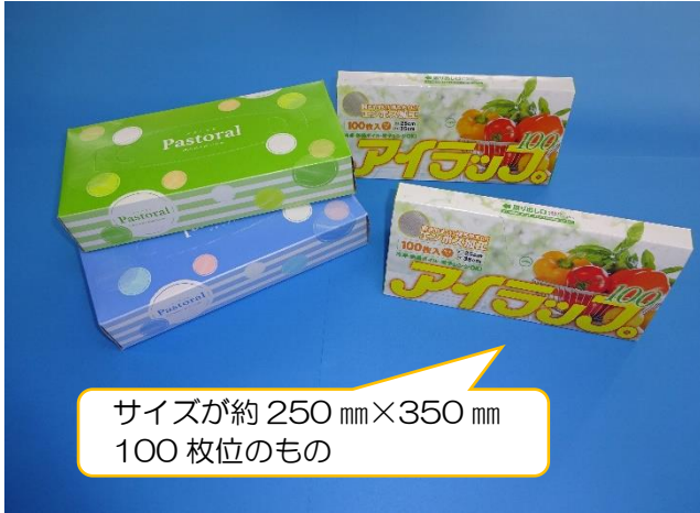
【ティッシュペーパー・ポリ袋（箱入り）】