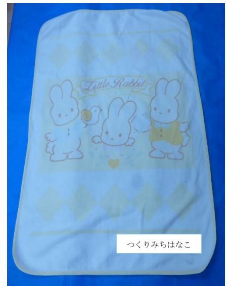
【午睡用具 ベビー毛布】