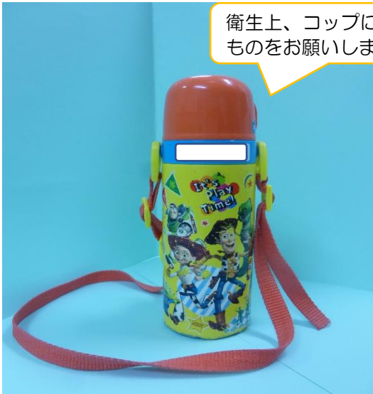
【3. 4. 5歳児 水筒】