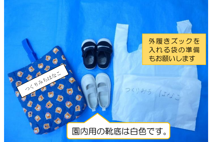
【内履きズック・外履きズック・ズック袋】